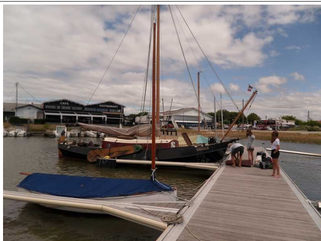
Au ponton « Patrimoine »