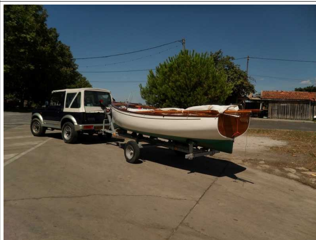
Sortie de l'eau