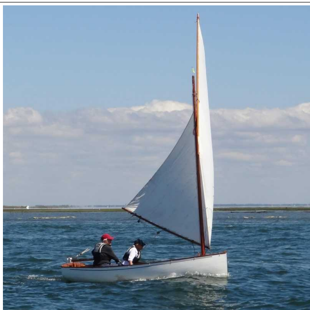
En régates au Canon (Bassin d'Arcachon)